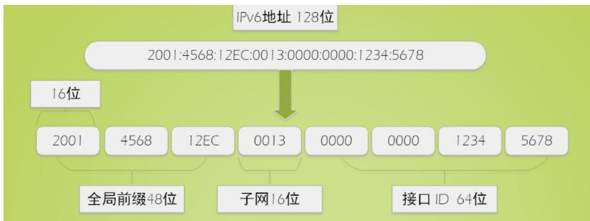
图 1 128 位的 IPv6 地址

相比 IPv4，IPv6 能够提供海量的地址空间，IPv6 的地址长度为 128bit，能够提供 2 的 128 次方个地址，这个数量已经大到无法想象，一个很形象的比喻是 IPv6 几乎可以为地球上的每一粒沙子都分配一个地址。可见，IPv6 打破了 IPv4 地址的局限性，可为后续万物互联的世界提供充足的地址。